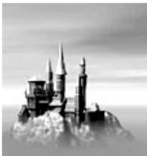
Juan Peña fue el constructor del singular edificio surgido mágicamente desde las entrañas de la tierra.

Su localización siempre ha sido un secreto y ha ido variando a lo largo del tiempo. Sin embargo, desde hace cuatro siglos, se encuentra en un valle de los Pirineos oculta por poderosos encantamientos que evitan la aproximación de los mundanos.